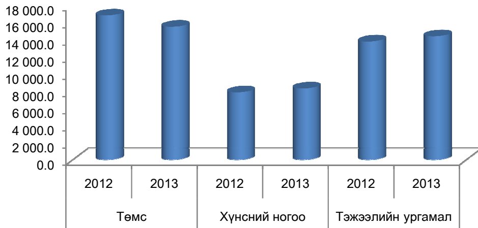
Монгол улсын төмс, хүнсний ногоо тариалалт, га

2013 онд үр тариа 186986.3 тн, төмс 56020.2 тн, хүнсний ногоо 35474.9 тн хураан авсан нь 1960 онтой харьцуулахад үр тариа 76998.3 тн, төмс 11.3 дахин, хүнсний ногоо 37.2 дахин их ургац хураан авсан, 1990 онтой харьцуулахад үр тариа 5012.6 тн-оор бага ургац, төмс 24719.8 тн, хүнсний ногоо 4.7 дахин их ургац хураан авч бол 2010 оны мөн үетэй харьцуулахад үр тариа 9327.5 тн, төмс 13270.6 тн, хүнсний ногоо 5222.0 тн ургац тус бүр илүү хураан авсан байна.